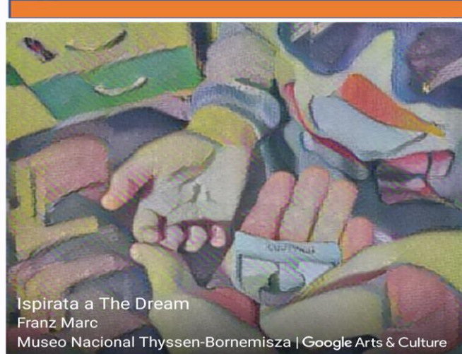
Ispirata a The Dream Franz Marc Museo Nacional Thyssen-Bornemisza

Saranno organizzati una serie di incontri formativi su piattaforma web, al fine di illustrare il progetto e la nostra proposta di condivisione: