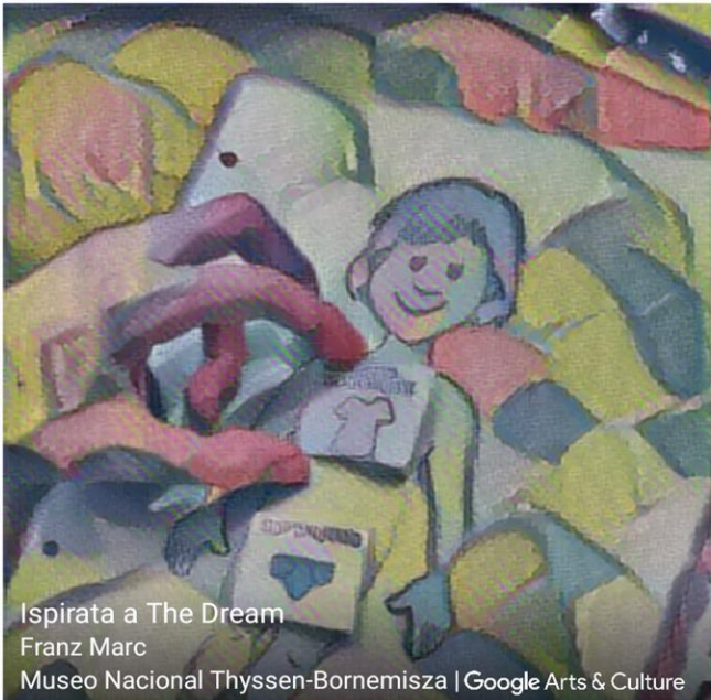
Ispirata a The Dream Franz Marc Museo Nacional Thyssen-Bornemisza | Google Arts & Culture

UN VESTITO SU MISURA PER OGNI BAMBINO, RAGAZZO, PERSONA